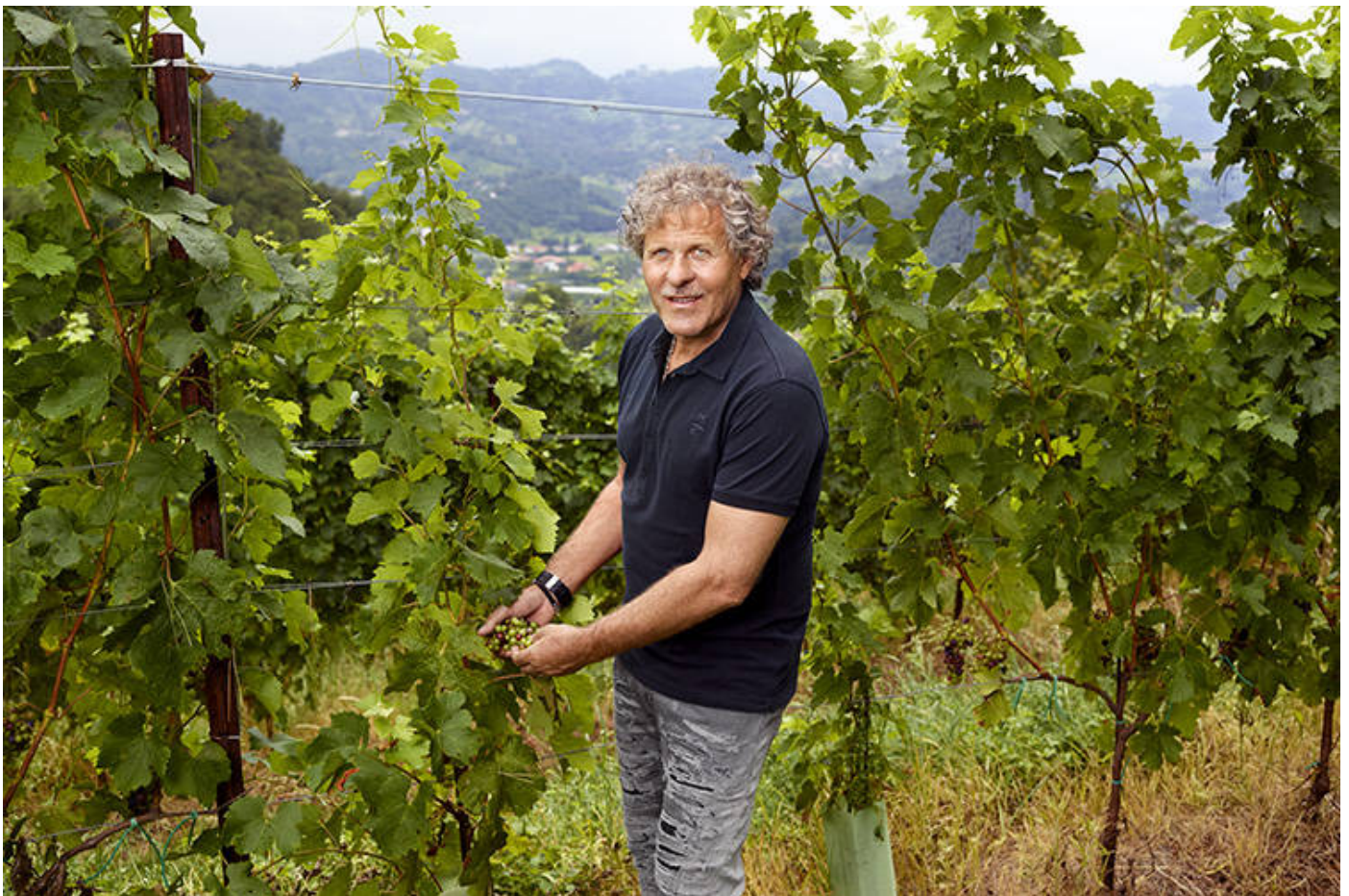
Renzo Rosso