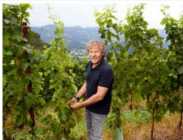
Renzo Rosso tra i vigneti della Diesel farm

Continua l'interesse di Red circle investments per il settore vitivinicolo di alta gamma. La società di investimenti privati del fondatore di Diesel e presidente del gruppo Otb-Only the brave, Renzo Rosso , ha sottoscritto un accordo vincolante per l'acquisizione di una quota di partecipazione di minoranza qualificata in Benanti , pregiata cantina siciliana nata nel 1988.