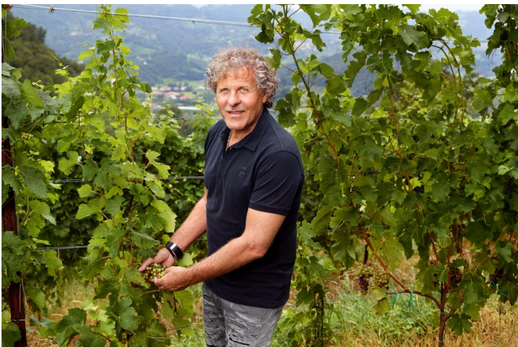
Renzo Rosso at the Diesel farm