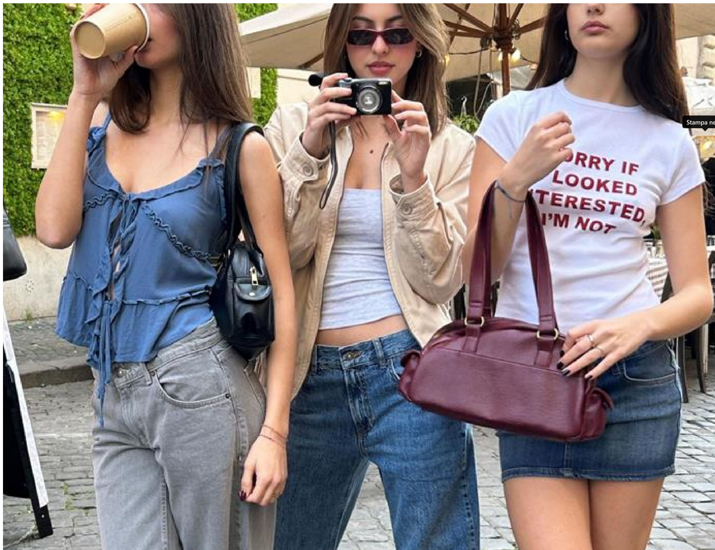
Un adv Subdued

Nuo rileva il 30% della controllante di Subdued . Osit , la società romana proprietaria del fashion brand italiano, ha annunciato l'ingresso della holding di partecipazioni nel proprio capitale sociale per lo sviluppo del marchio su scala globale. Secondo quanto risulta a MFF , si tratta del più importante investimento in termini economici di Nuo e, secondo fonti finanziarie, l'investimento si aggirerebbe sui 70 milioni di euro.