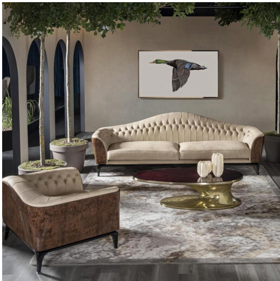
Produzioni del brand Visionnaire