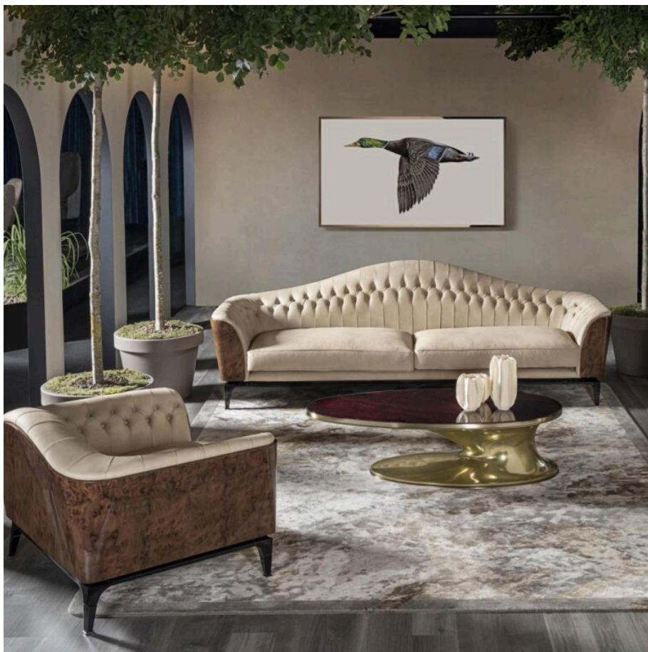
Produzioni del brand Visionnaire