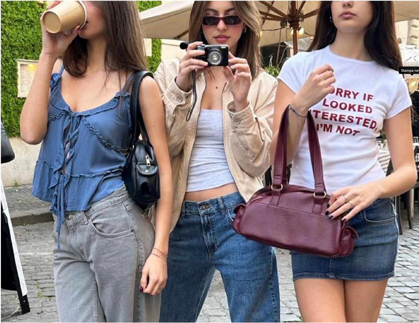
Un adv Subdued (courtesy Subdued)

di MATTEO ZHU 🕒 TEMPO DI LETTURA 1 MIN LEGGI DOPO