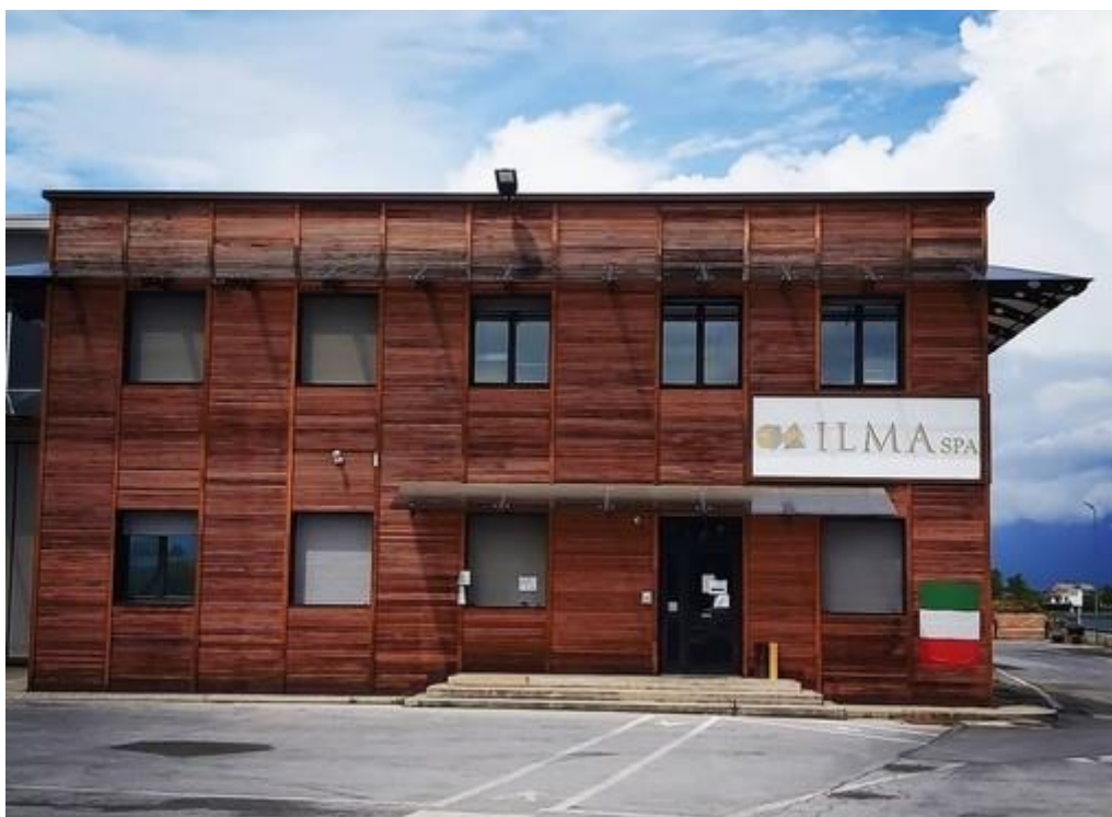
La sede dell'azienda di Magliano Alpi

Specializzata nella produzione di tetti, pareti e strutture in legno per l'edilizia la società monregalese diventerà il nucleo di un nuovo gruppo nel settore della bioedilizia. Si punta a raddoppiarne il mercato di riferimento nel giro di quattro anni